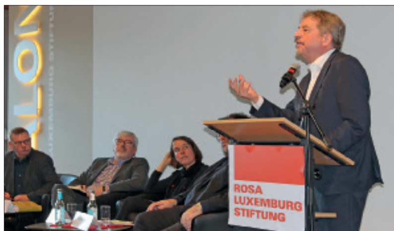
➤ Der katholische Sozialphilosoph Hans Joas bei seinem Vortrag in der Rosa-Luxemburg-Stiftung.

Tatsächlich war im gut besuchten „Salon“ der Luxemburg-Stiftung das Bemühen spürbar, die Debatte über Kirchen und Religionsgemeinschaften ohne Scheuklappen zu führen. Viele Argumente hätten auch in eine Katholische Akademie gepasst – so vor allem